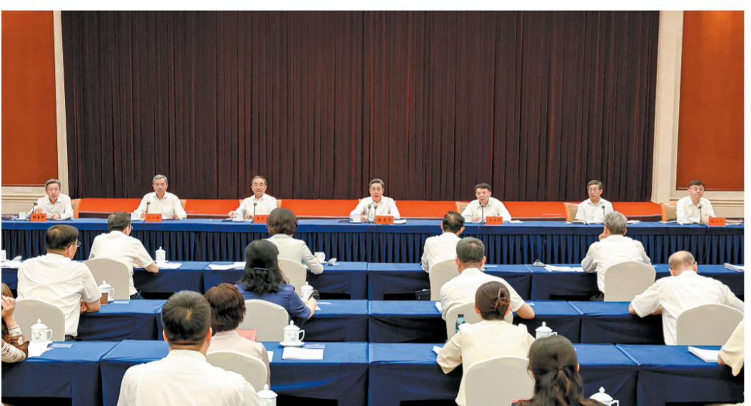
2026年“百名法学家百场报告会”法治宣讲活动组委会会议9日在京召开。中共中央政治局委员、中国法学会会长陈文清出席会议并讲话。

本报北京7月10日讯 记者蔡长春 2026年“百名法学家百场报告会”法治宣讲活动组委会会议9日在京召开。中共中央政治局委员、中国法学会会长陈文清出席会议并讲话。