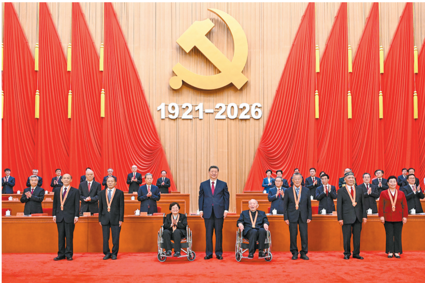
7月1日上午，庆祝中国共产党成立105周年大会在北京人民大会堂隆重举行。中共中央总书记、国家主席、中央军委主席习近平向“七一勋章”获得者颁授勋章。

新华社北京7月1日电 庆祝中国共产党成立105周年大会7月1日上午在北京人民大会堂隆重举行。中共中央总书记、国家主席、中央军委主席习近平向“七一勋章”获得者颁授勋章并发表重要讲话。他强调，105年来，我们党始终坚守为中国人民谋幸福、为中华民族谋复兴的初心使命，在不懈奋斗中创造了彪炳史册的伟大成就。新征程上，全党同志要坚定信心、接续奋斗，不断创造无愧于时代和人民的业绩。 中共中央政治局常委李强、赵乐际、王沪宁、蔡奇、丁薛祥、李希、国家副主席韩正出席大会。 上午9时， “七一勋章”获得者集体乘坐礼宾车从驻地出发，由礼宾摩托车队护卫前往人民大会堂。人民大会堂北门外，礼兵分列道路两侧，青少年热情欢呼致敬。“七一勋章”获得者沿着红毯拾级而上，进入人民大会堂。党和国家功勋荣誉表彰工作委员会有关领导同志等，在这里集体迎接他们到来。 人民大会堂大堂气氛庄重热烈。主席台上方悬挂着“庆祝中国共产党成立105周年大会”会标，后幕正中是熠熠生辉的中国共产党