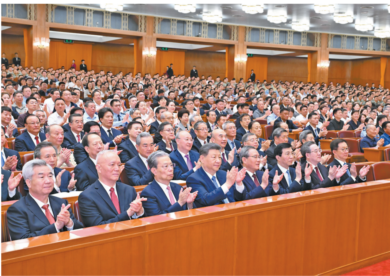
6月29日晚，庆祝中国共产党成立105周年音乐会《人民至上》在北京举行。习近平、李强、赵乐际、王沪宁、蔡奇、丁薛祥、李希、韩正等党和国家领导人，同约3000名观众一起观看演出。