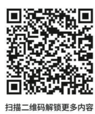
扫描二维码解锁更多内容