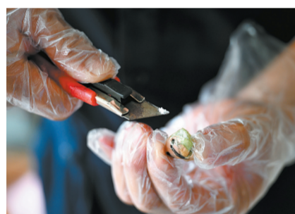
6月8日,在瑞丽市某物流园区,带犬民警使用刻刀逐层切开包裹,检验毒品可疑物。

6月9日清晨,云南省出入境边防检查总站德宏边境管理支队江桥警犬训练基地“功勋犬”墓园。薄雾悠悠萦绕,漫铺于清寂山野,静谧而肃穆。一方方整齐的墓碑静静矗立,这里长眠着15只曾冲锋在中缅边境缉毒最前沿的功勋缉毒犬。