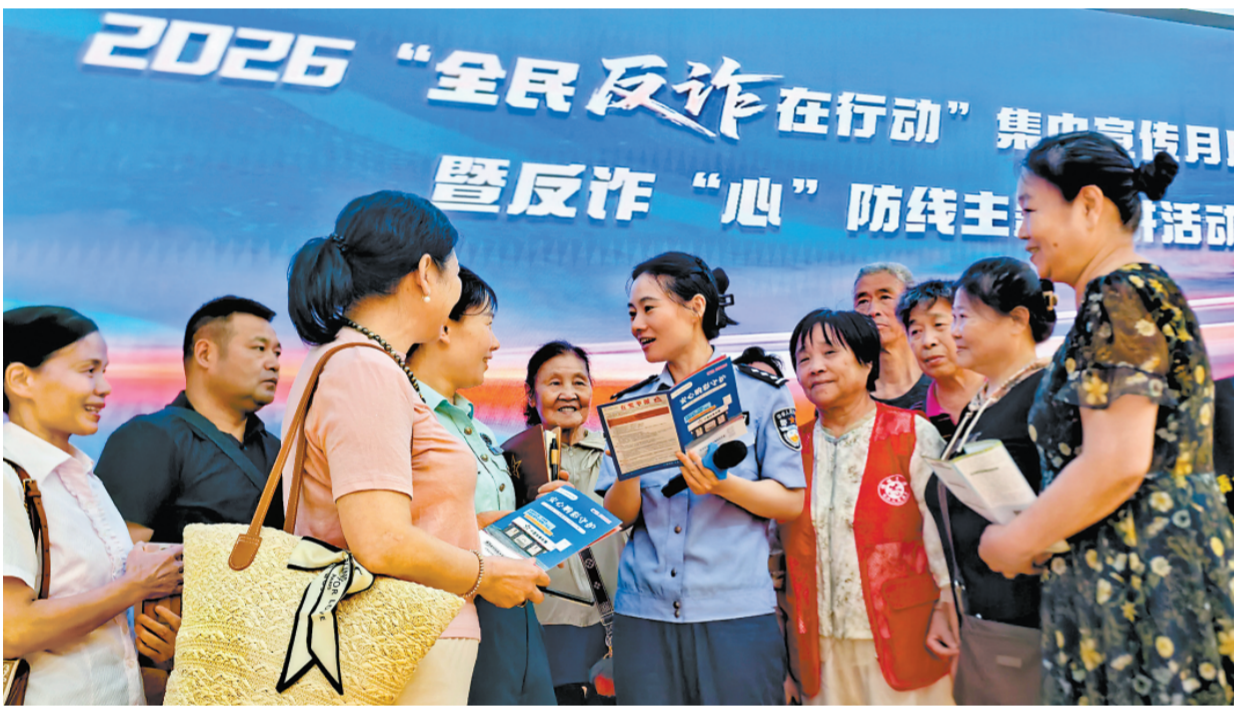
6月12日，河南省郑州市公安局金水分局经八路派出所组织民辅警深入辖区开展反诈宣传。图为民警向群众讲解防范养老诈骗常识。本报记者 赵红旗 本报通讯员 刘书亭 摄