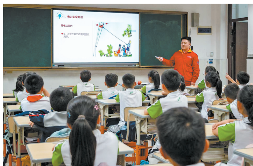
近日，国网丽水供电公司组织共产党员服务队走进浙江省丽水市遂昌县实验小学，开展以“电力安全进校园 安心守护伴成长”为主题的电力普法宣传活动。图为服务队队员结合典型案例，向同学们普及电力安全知识。