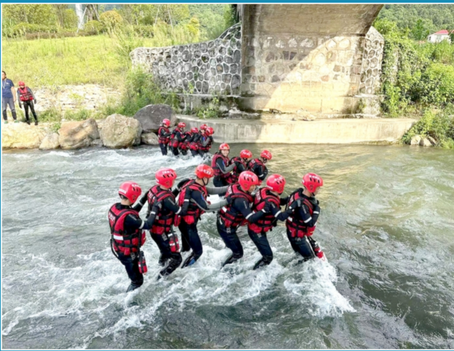
为全面提升消防救援队伍水域救援实战能力，江西省萍乡市消防救援支队近日开展水域救援技术培训，设置急流漂浮、水中自救、涉水行进、翻船自救、抬轿救援、横渡救援等训练科目，有效提升突发险情下的快速响应与协同作战能力。图为消防救援人员开展水域救援演练。

据了解，农业农村部将会同公安、海警等部门完善配套制度规范，持续做好长江十年禁渔、海洋伏季休渔和黄河休渔禁渔，打击非法捕捞、“三无”船舶等重点领域执法监管，开展针对性练兵比武等强化提升执法队伍能力水平。