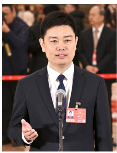
图为全国人大代表杨永修。