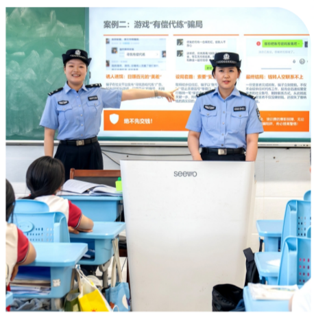
6月1日,上海市公安局崇明分局民警走进辖区西中学,开展“守护青春 远离诈骗”反诈主题宣讲活动,图为民警通过案例讲解,提升学生反诈防骗意识。