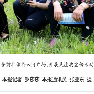
近日,河南省安阳县人民法院组织干警来到辖区法治文化主题公园,开展民法典宣传月系列宣传活动。

本报讯 记者徐伟伦 近日,2026年北京市丰台区民法典宣传月主题宣传活动正式启动。宣传月期间,丰台区将策划开展120场特色活动。