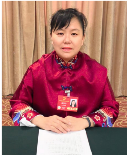
图为全国人大代表盛秀玲。