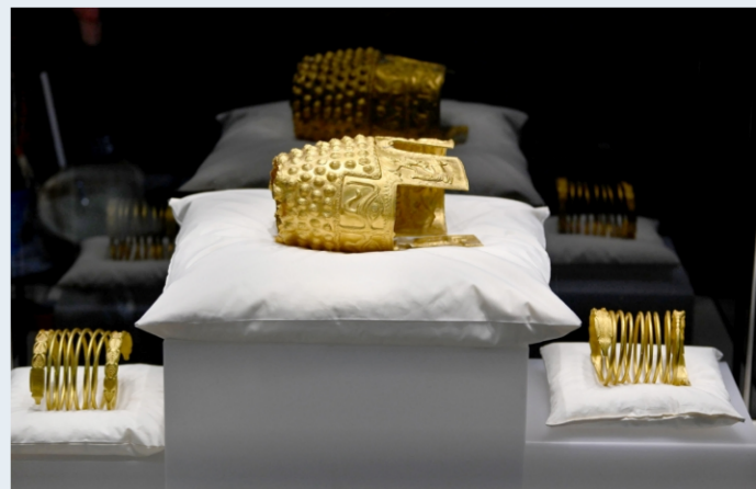
图为当地时间2026年4月21日,罗马尼亚布加勒斯特国家历史博物馆举行媒体展示活动,展出复原的达契亚金器文物,包括一顶仪式金头盔和两只金手镯。这些文物于2025年在荷兰被盗,现已归还罗马尼亚,其年代可追溯至公元前450年左右,属于古代达契亚文明。

从全球文化遗产治理的角度来看,新法被视为一个新起点,为国际文物追索提供了新的法律依据。文物归还不会一帆风顺,原属国仍需付出诸多努力。同时专家也提醒,文物归还只是第一步,更重要的是建立全球文化遗产共享机制,实现文明的平等对话。