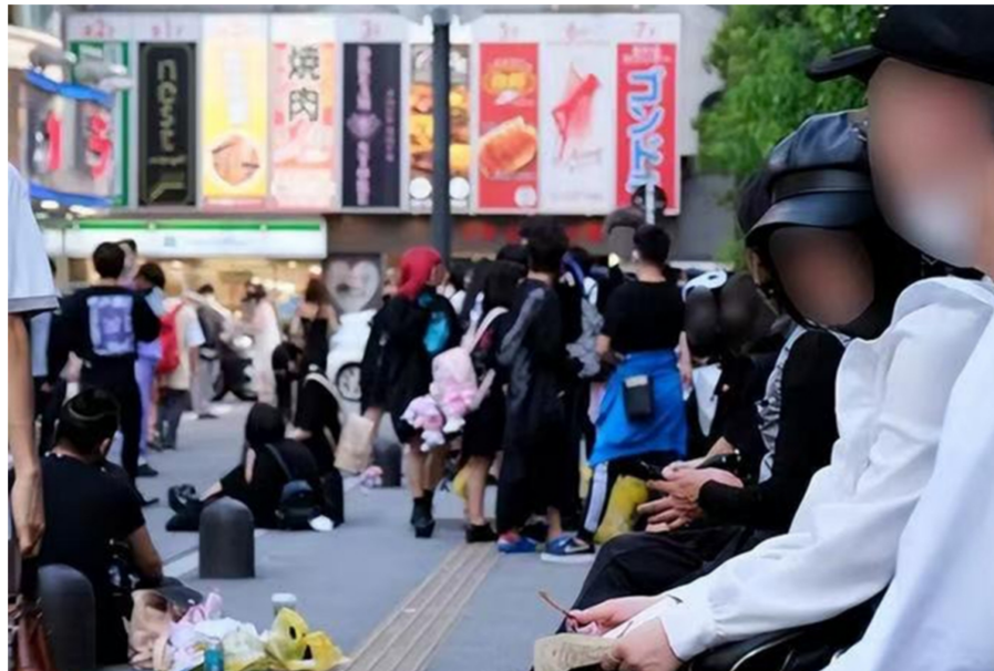
图为聚集在东横街头无家可归的青少年。