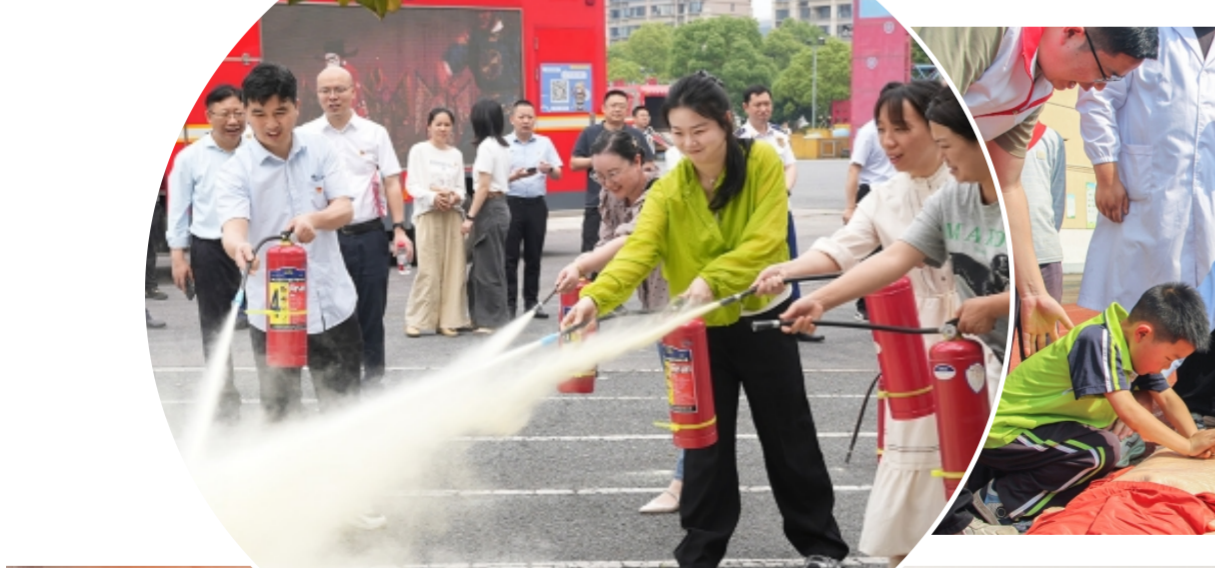
图② 5月12日,江西省萍乡市直机关工委等部门组织工作人员走进市消防救援局,学习家庭防火、火灾逃生等消防安全知识,图为工作人员学习操作灭火器。