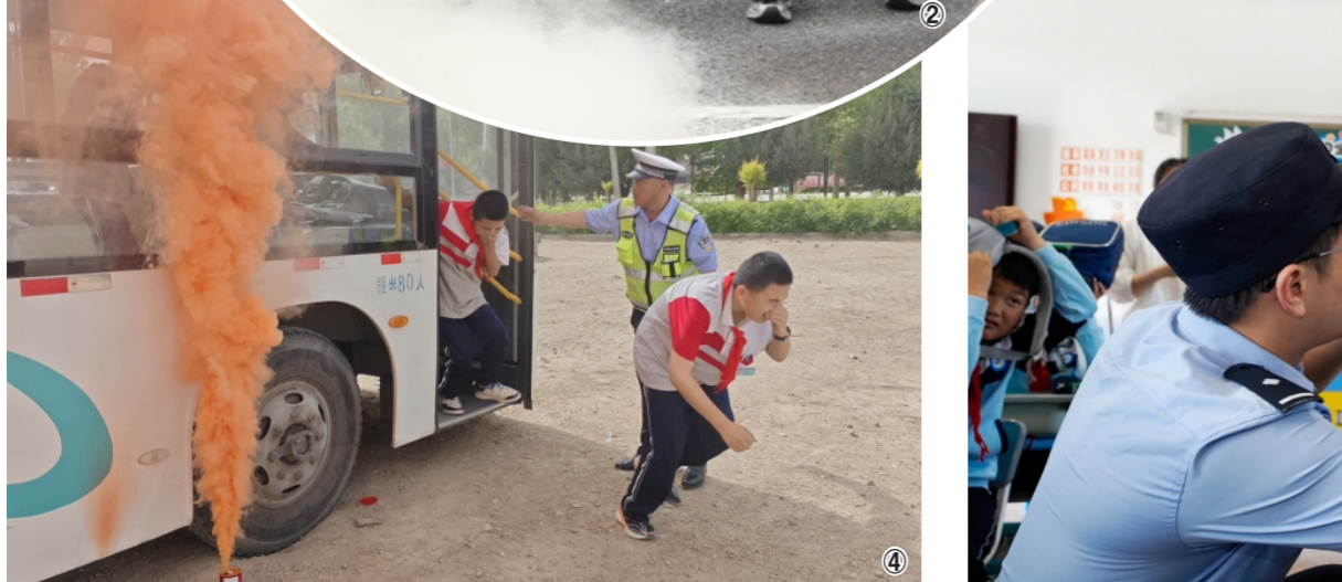
图③ 5月12日,上海市公安局崇明分局新村派出所民警联合辖区卫生院,在新村小学开展防灾减灾应急演练,图为民警组织学生进行自救互救知识。