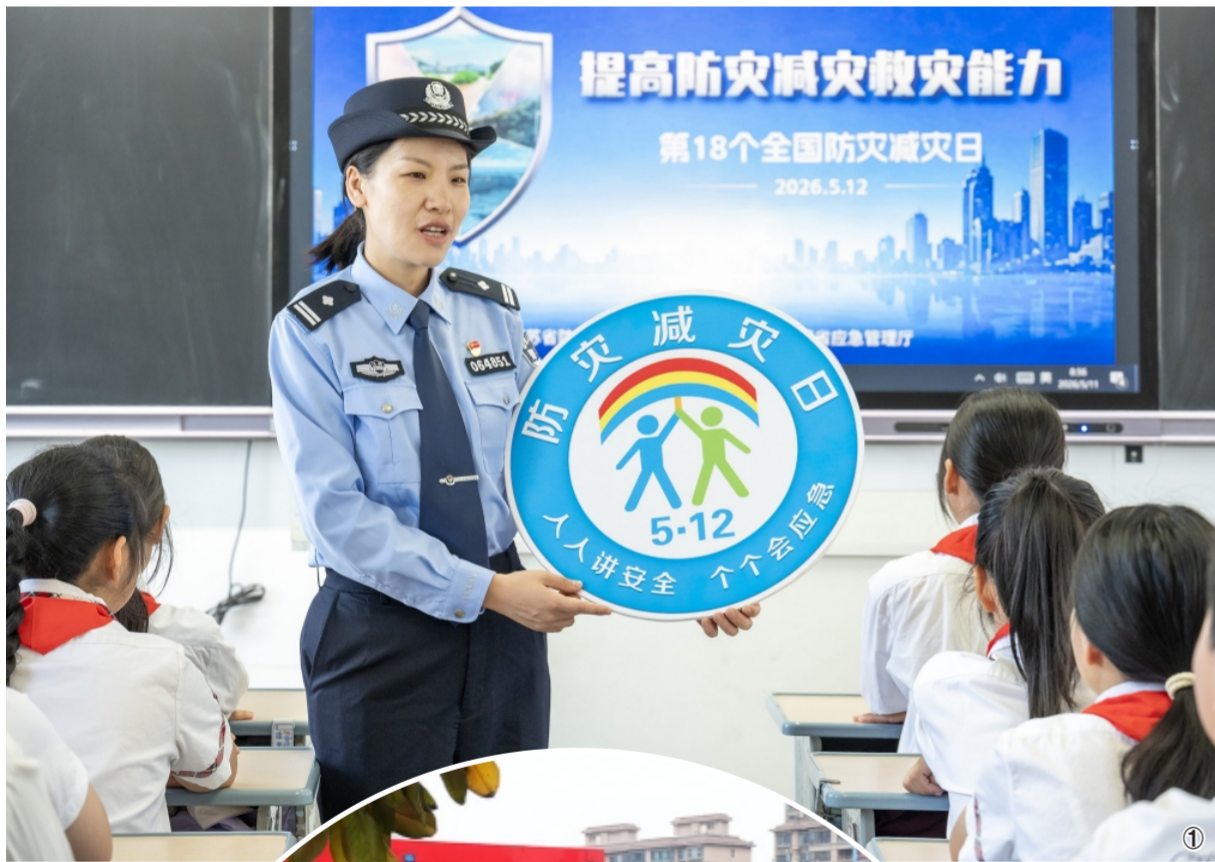
图① 近日,江苏省海安市公安局城南派出所组织民警走进辖区小学开展防灾减灾主题宣传活动,图为民警向学生讲解防灾减灾知识。

据了解,本次活动以“一堂课、一场致敬、一次体验”为主线,通过开展全民安全公开课、宣讲防灾减灾感人故事、模拟体验应急演练等形式,进一步普及防灾减灾知识,增强公众防灾减灾意识和自救互救能力。活动现场,12名全国基层防灾减灾优秀代表受到表彰,并向全社会发出“人人讲安全、个个会应急、筑牢防灾减灾救灾人民防线”的倡议。