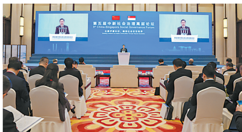
第五届中新社会治理高层论坛20日在浙江杭州举行。中共中央政治局委员、中央政法委书记陈文清出席并致辞。