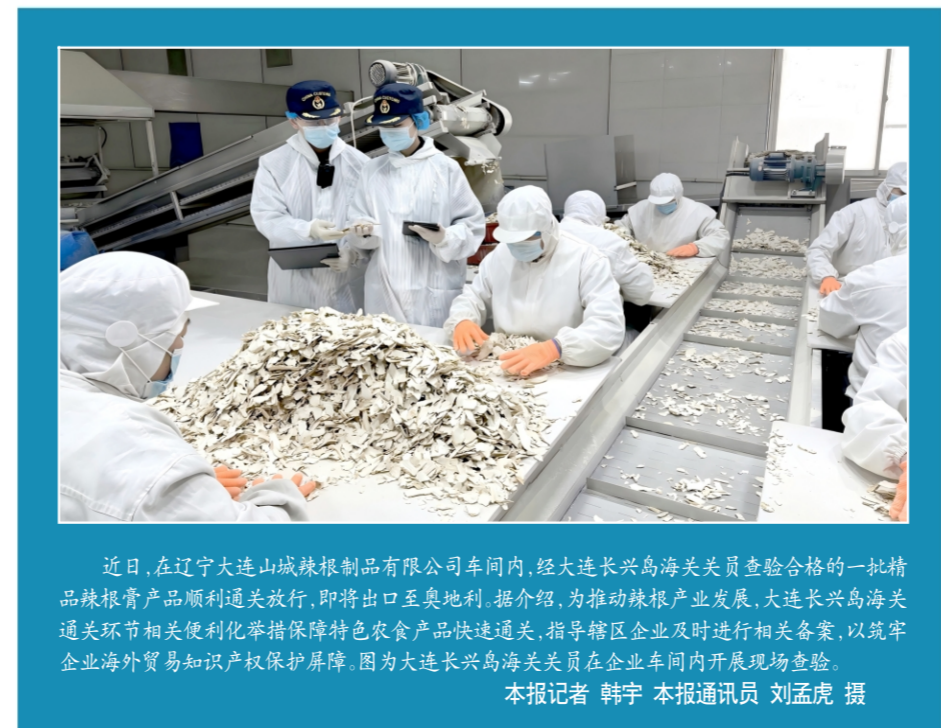
近日,在辽宁大连山城辣制品有限公司车间内,经大连长兴岛海关关员查验合格的一批辣味辣酱产品顺利通关放行,即将出口至奥地利。据介绍,为推动辣酱产业发展,大连长兴岛海关通关环节和便利化举措保障特色农产品快速通关,指导辖区企业及时进行相关备案,以筑牢企业海外贸易知识产权保障屏障。图为大连长兴岛海关关员在企业车间内开展现场检查。

据悉,下一步,市场监管总局将加快建设质量基础设施公共服务平台,推动质量基础设施服务从“一站式”向“一体化”升级,推动构建质量管理协同、质量资源共享、技术优势互补的良好产业生态。