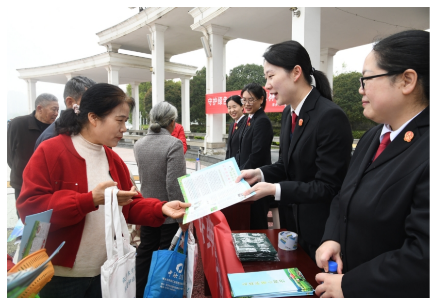
近日，江西省萍乡市中级人民法院组织干警走进萍乡玉湖省级湿地公园，通过以案说法、互动问答等方式，向群众宣传生态环境法典相关知识，并就群众关心的法律问题进行解答。图为法院干警向群众普及生态环境法典相关知识。