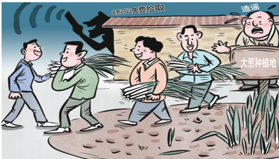
漫画 高岳 文孜然

据媒体近日报道,有人称江苏南通一处大葱种植地可以免费拾取大葱,引发部分不明真相的群众前去哄抢大葱。相关部门获悉后及时赴现场处置,经核查,按当前大葱收购价预估农户损失在1万至2万元之间。