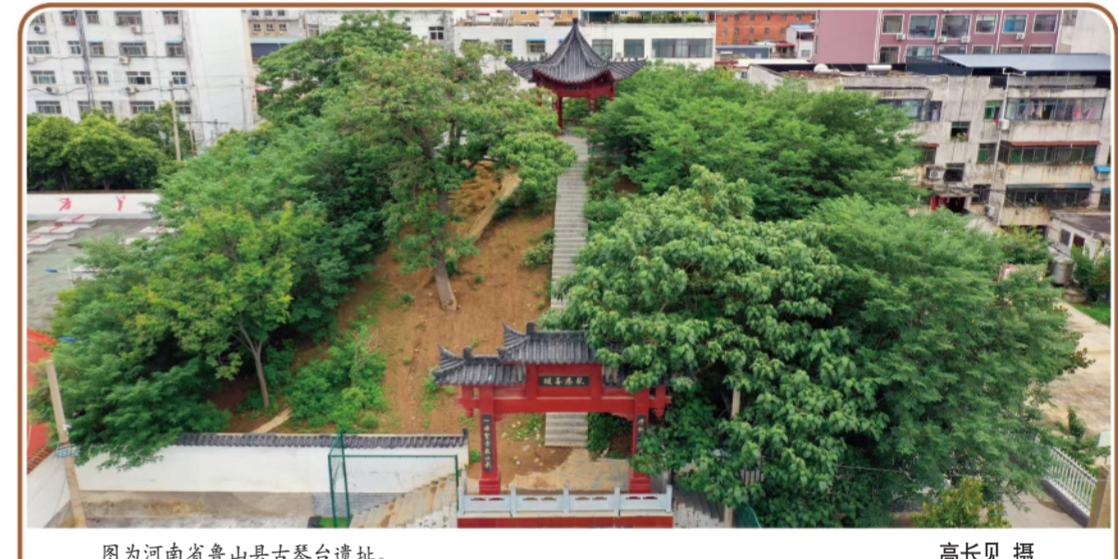
图为河南省鲁山县古琴台遗址。

总之，《数字法学》的理论贡献在于通过对权利、义务、责任的数字化重构，回答了数字时代法学自洽与自治的核心命题。传统法学“三驾马车”并未过时，而是以更丰富内涵、更多元形态支撑数字法学理论大厦，彰显了中国自主法学体系构建的时代智慧。换言之，在数字技术持续迭代背景下，数字法学核心范畴仍将发展，但权利、义务、责任的核心骨架地位不可动摇。未来法学研究应立足数字社会实践，深化核心范畴阐释，完善数字权利保护、义务履行与责任追究规则，使数字法学成为规范数字社会秩序、保障数字人权、实现数字正义的理论支撑，为数字文明发展提供坚实的法治基础。