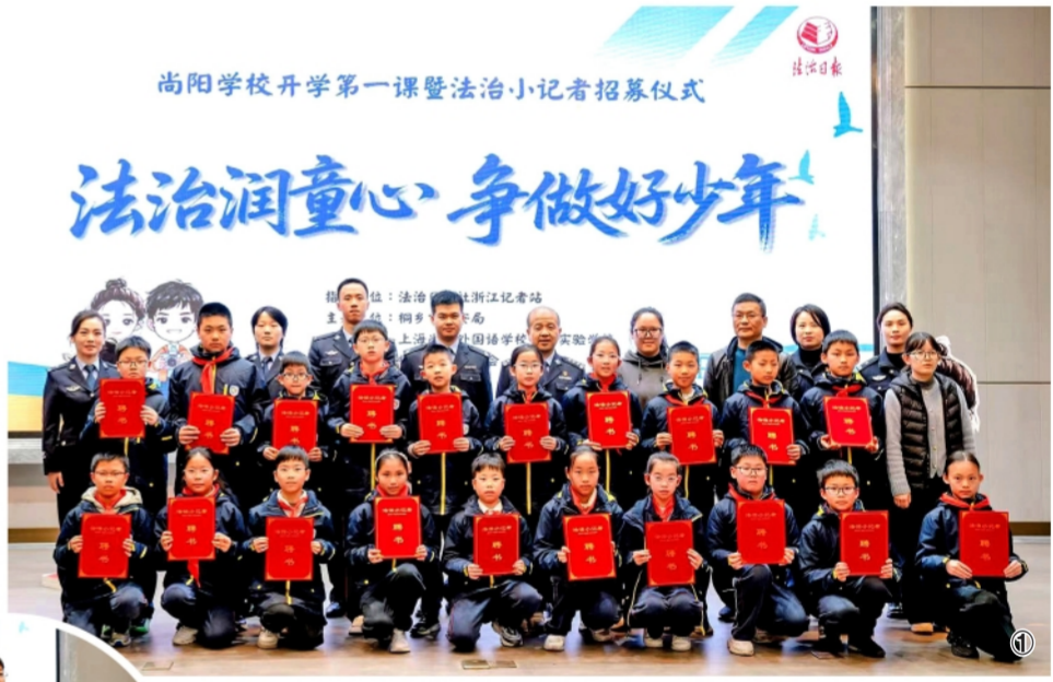
尚阳学校开学第一课法治小记者招募仪式