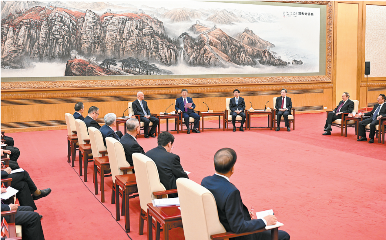
2月11日,习近平、王沪宁、蔡奇、丁薛祥等在北京人民大会堂同党外人士欢聚一堂,共迎佳节。