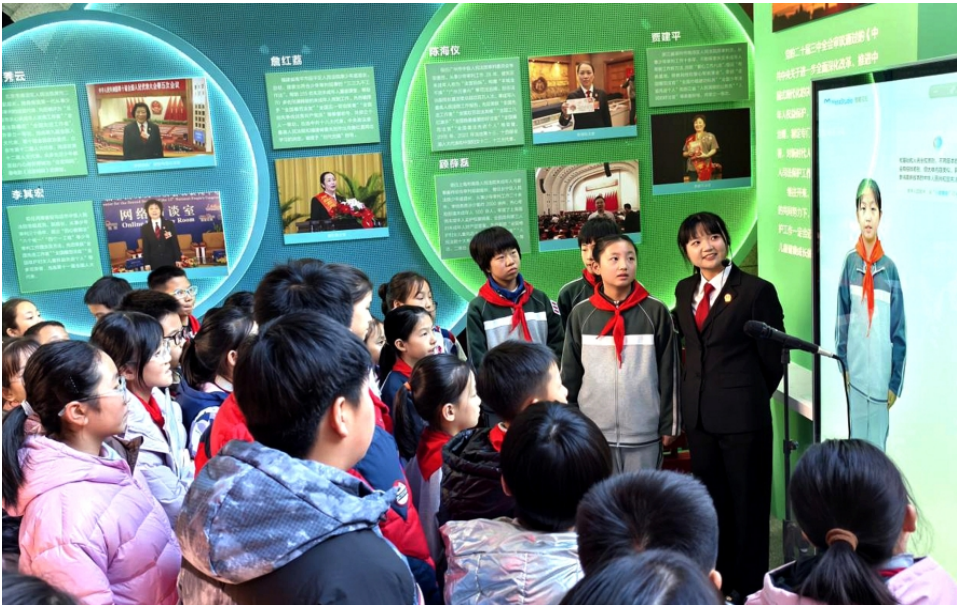
图为在中国法院博物馆少年法庭成立40周年成就展展厅，学生们现场体验“小安同学”的答疑功能。

上线一年，“小安同学”已经成为辖区校园里孩子们熟悉的伙伴，累计完成各类问答2000余次，无论是校园欺凌、家庭矛盾，还是日常法律疑问，孩子们都愿意跟这个“永远在线的小伙伴”分享。其创新实用的护未模式不仅斩获“中国法研杯”一等奖，更成功入选最高人民法院未成年人特色案例库，成