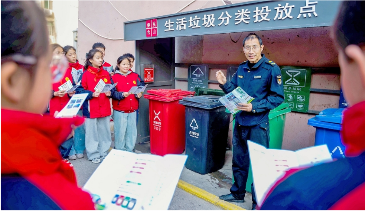
近日，安徽省含山县城市管理局联合环峰小学开展垃圾分类进校园活动，图为工作人员在垃圾投放点向学生们普及垃圾分类知识。

从制度层面的规范约束到执法方式的创新升级，再到复议渠道的高效赋能，新疆涉企行政执法正以更规范的流程、更高效的服务、更有力的保障，为经济社会高质量发展注入了强劲法治动能。