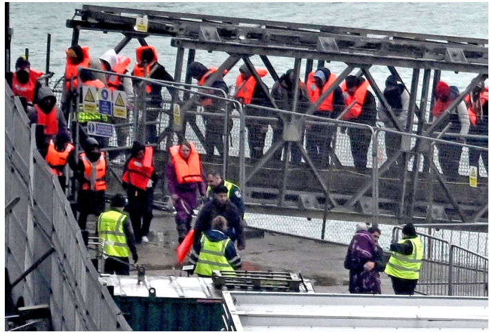
当地时间2025年5月21日，英国多佛，从法国试图穿越英吉利海峡的移民被边境部队船只“游骑兵”号救起后，在多佛码头下船。

事实上，非法移民与难民问题的根源，在于部分地区的战乱、贫困、政治动荡，以及全球发展的严重失衡。英国与这些地区有着复杂的历史联系与现实羁绊，仅靠单边收紧边境政策，向他国转嫁危机，根本无法从根源上解决问题。真正的解决方案，必然建立在平等相待的国际合作基础之上：通过助力来源国发展，化解地区冲突，缩小发展差距，从源头减少移民潮的产生。