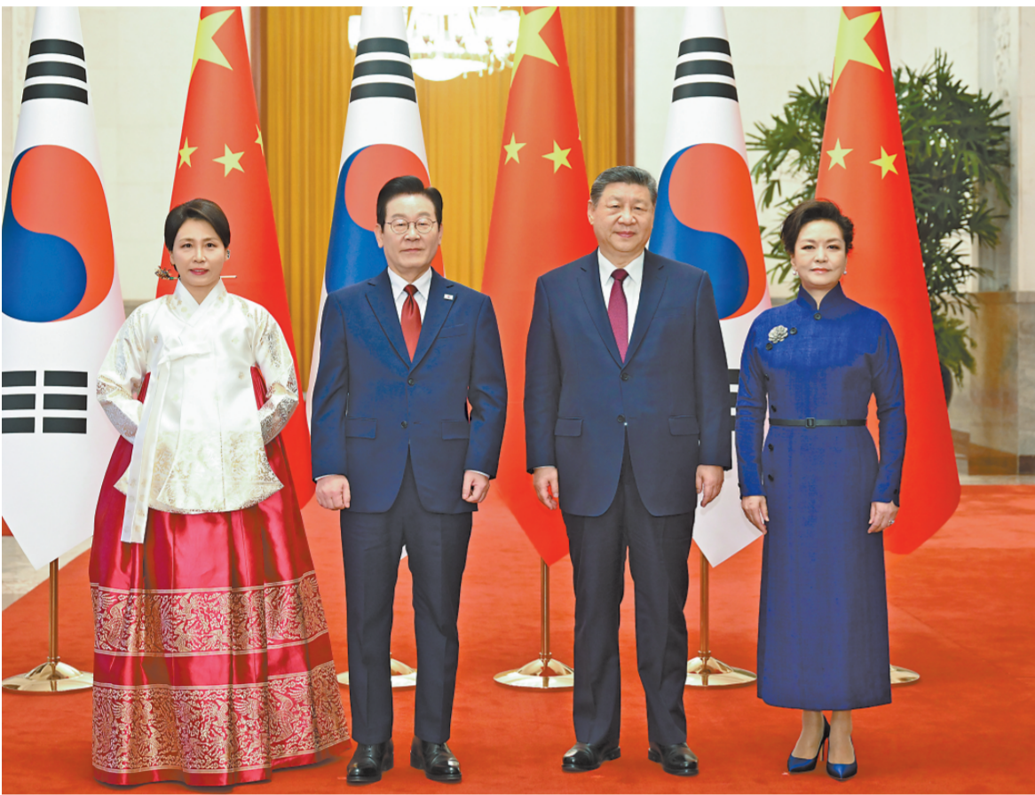
一月五日下午，国家主席习近平在北京人民大会堂同来华进行国事访问的韩国总统李在明举行会谈。这是会谈前习近平和李在明夫妇在人民大会堂合影留念。

新华社北京1月5日电 记者冯敬然 曹翊翔 1月5日下午，国家主席习近平在北京人民大会堂同来华进行国事访问的韩国总统李在明举行会谈。