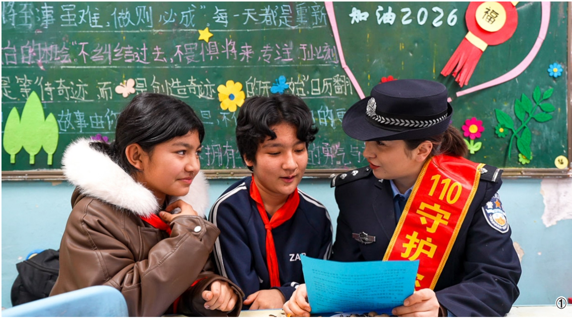
图① 1月4日,新疆维吾尔自治区叶城县公安局组织民辅警深入辖区校园,开展普法宣传活动。活动中,民警通过互动问答等形式,进一步提升学生的自我保护能力和应急处置水平。图为民警向学生们讲解如何正确拨打110报警电话。