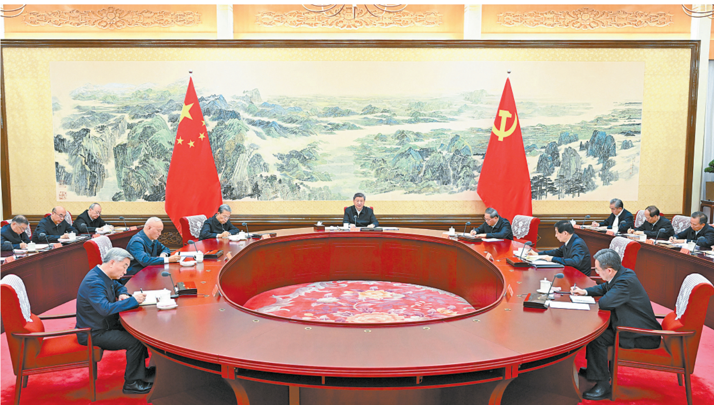
12月25日至26日，中共中央政治局召开民主生活会，中共中央总书记习近平主持会议并发表重要讲话。