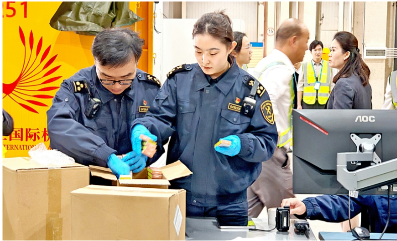
图为12月18日,在海口美兰机场“二线口岸”,加绿巧食品制造业(海南)有限责任公司的加工增值内销免关税货物接受海关监管。

18日一大早,海南其他“二线口岸”也热闹起来,通关货物“遍地开花”。在马村港,装载海南远丰食品有限公司烘焙加工的咖啡豆的车辆正缓缓驶入海口港“二线口岸”马村港区,接受海关验核放行后发往广东。在万宁,一家企业的豆蔻拼配咖啡豆加工产品,从琼海博鳌机场“二线口岸”通关,空运前往深