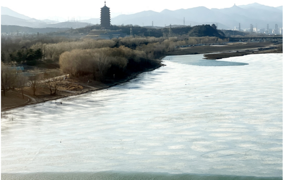
京津冀三地就永定河保护开展协同立法。图为永定河北段。

据了解，水利部在深入调查研究，广泛征求意见基础上起草了防洪法修订草案送审稿，司法部已征求中央有关部门、地方人民政府，有关行业协会、研究机构和企业等方面意见。应急管理部建议，认真研究采纳议案提出的意见建议，做好法律修改与突发事件应对法等法律的衔接。