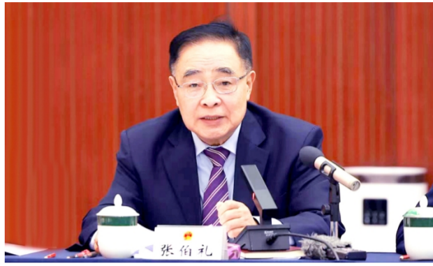
图为全国人大代表张伯礼。