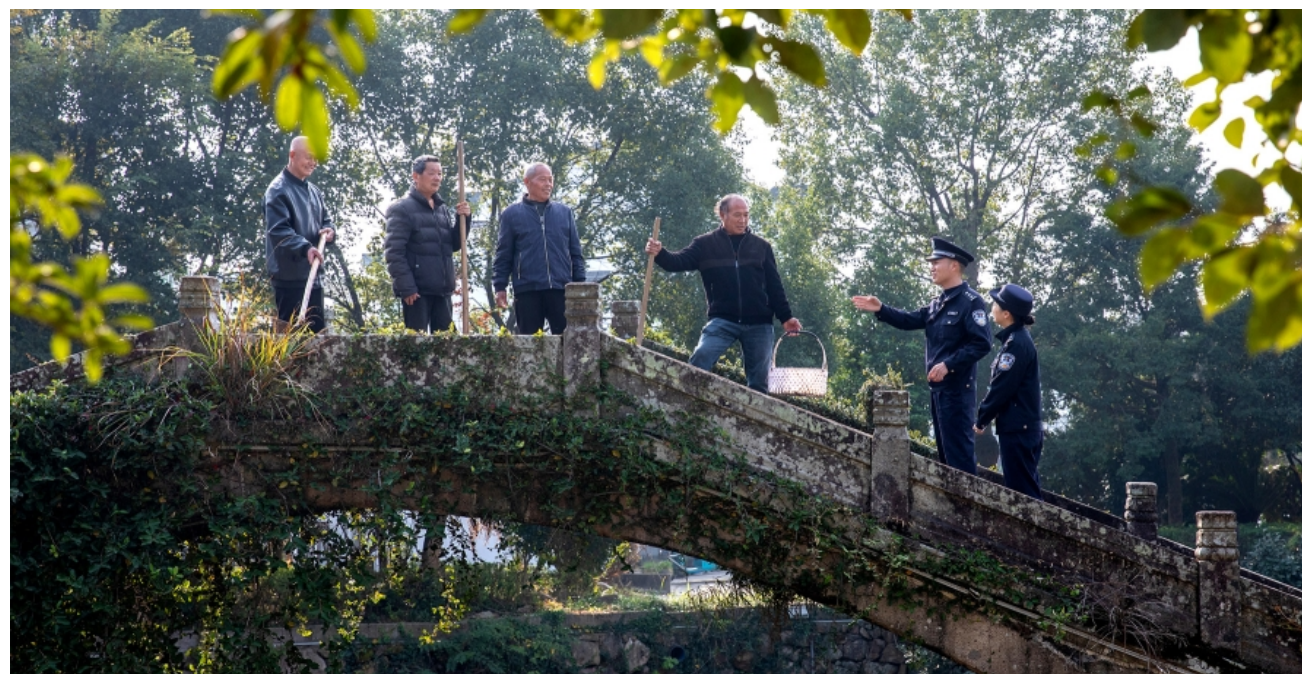
12月3日,浙江省台州市公安局黄岩分局北洋派出所民警在小里桥村走访群众,听民声、访民情、集民意,同时开展冬季安全防范宣传。

2025年4月,芜湖汪某文侵犯商业秘密案入选最高人民法院、最高人民检察院联合发布的知识产权刑事保护典型案例。 在该案中,汪某文从某汽车公司离职时,以拆卸带走电脑硬盘的方式获取两份技术资料,其合理许可使用费评估为114万元。经芜湖经济技术开发区人民检察院提起公诉,芜湖经济技术开发区人民法院对该案进行审理,认为汪某文的行为属于以盗窃的不正当手段获取商业秘密的行为,且属于“情节严重”,依法判处有期徒刑。 该案彰显了安徽法检两院对创新成果的严格保护。