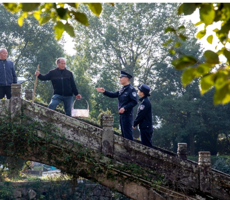
12月3日,浙江省台州市公安局黄岩分局北洋派出所民警在小里桥村走访群众,听民声、访民情、集民意,同时开展冬季安全防范宣传。

全省法院系统持续强化审判机制建设,目前已形成由省高级人民法院、16个中级法院、18个基层法院、合肥知识产权法庭组成的全省法院知识产权案件专业化审判体系,通过厘清技术中立认定规则,探索单纯非法获取型侵犯商业秘密行为入罪规则等,加强对集成电路、人工智能等前沿科技领域创新成果的保护,同时进一步完善技术事实查明机制,加强保全措施、民事调查令适用,及时收集、固定证据,并运用从业禁止令,依法惩治侵犯技术秘密和经营信息行为,严格落实惩罚性赔偿制度,细化惩罚性赔偿适用标准,惩处严重侵害知识产权行为。2024年,全省法院系统13个知识产权案例入选全国典型案例;在9件案件中适用惩罚性赔偿,最高判赔额达2000万元。