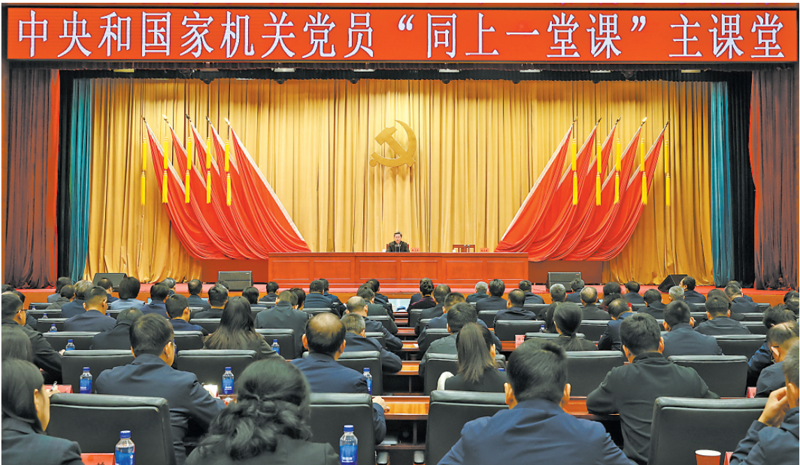
十二月八日，中共中央政治局委员、中央政法委书记陈文清在京围绕“深入学习贯彻习近平法治思想 合力开创法治中国建设新局面”为中央和国家机关党员“同上一堂课”作专题辅导。

因地制宜做好经济工作，实现高质量、可持续发展。编制好国家和地方“十五五”规划及专项规划。做好岁末年初重要民生商品保供工作，关心困难群众生产生活，解决好拖欠企业账款和农民工工资问题，兜牢民生底线。以时时放心不下的责任感抓好安全生产，坚决防范遏制重特大事故发生。 会议指出，制定《中国共产党领导全面依法治国工作条例》，对于进一步提升党领导全面依法治国的科学化、制度化、规范化水平，建设更加完善的中国特色社会主义法治体系，建设更高水平的社会主义法治国家，具有重要意义。 会议强调，要坚持和加强党的领导，把党领导立法、保证执法、支持司法、带头守法落到实处，提高依法治国、依法执政水平。全面贯彻习近平法治思想，牢牢把握全面依法治国正确政治方向，坚定法治自信，坚定不移走中国特色社会主义法治道路，促使各级领导干部增强尊崇法治、敬畏法律意识，协同推进科学立法、严格执法、公正司法、全民守法，全面推进国家各方面工作法治化，为以中国式现代化全面推进强国建设、民族复兴伟业提供有力法治保障。