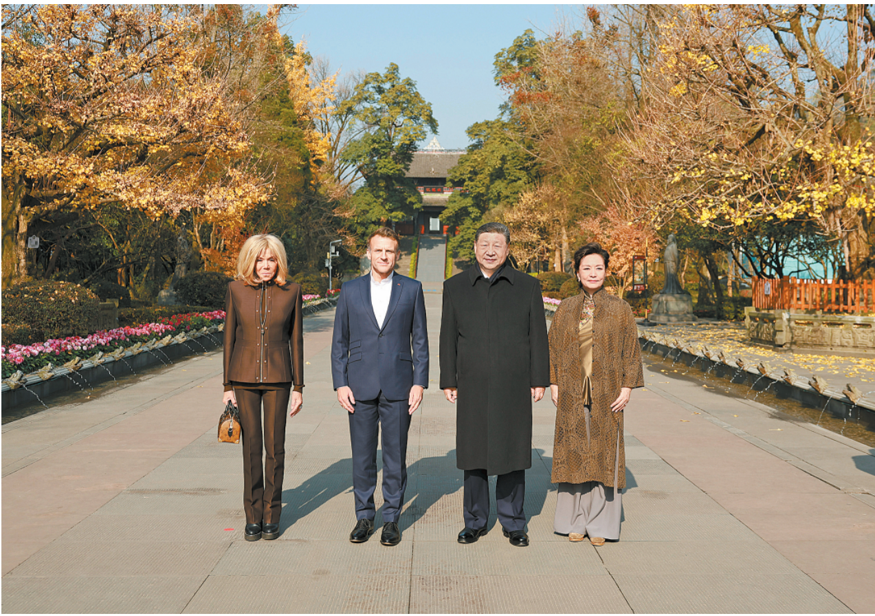
12月5日，国家主席习近平在四川省成都市都江堰同法国总统马克龙进行友好交流。这是习近平和夫人彭丽媛同马克龙夫妇合影。

新华社成都12月5日电 记者孙奕 吴光于 12月5日，国家主席习近平在四川省成都市都江堰同法国总统马克龙进行友好交流。 初冬的都江堰，苍山掩翠。马克龙夫妇抵达时，受到习近平和彭丽媛热情迎接。习近平欢迎马克龙到访“天府之国”，表示去年你邀请我赴你的家乡上比利牛斯省，相信你此行会进一步丰富对中国的认知。 两国元首夫妇沿堰边道边走边谈。 习近平介绍都江堰历史和意义，指出都江堰水利工程是全世界迄今唯一仍在使用的古代水利工程，也是人类与自然和谐共生最早的成功实践之一，修建过程充分反映了中华民族自强不息、不畏艰难、勇于开拓的精神。每次来到都江堰都能感受到先人因地制宜、顺势而为、天人合一、治水利民的伟大，从中汲取到治国理政的智慧。法兰西民