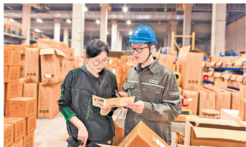
近日，国网温州供电公司组织工作人员走进浙江省温州市普洛斯特智慧物流枢纽，对园区企业的配电房、光缆分线箱等设备进行全面“体检”，同步开展安全用电宣传活动。图为供电公司工作人员向企业负责人讲解安全用电知识。

AI客服沦为一些企业敷衍消费者的“工具” 专家指出 “一键转人工”不是附加服务，是法定义务 详细报道见四版