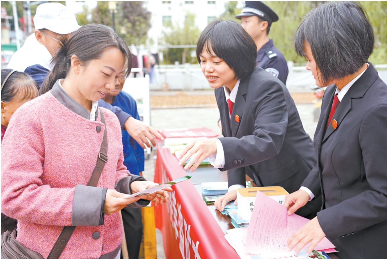
福建省清流县人民法院法官近日走进企朋乡,开展“严打非法采矿,守护青山绿水”主题法治宣传活动,引导村民自觉抵制违法行为,共同筑牢生态屏障。图为法官向群众讲解矿产资源保护相关法律法规知识。

文章指出,落实管党治党责任要进一步到位。抓好党建是本职,不抓党建是失职,抓不好党建是不称职。管党治党责任有主体责任、监督责任,第一责任人责任,“一岗双责”等,这些构成一个完整的责任链条,每一种责任都很重要,都要严格落实。各级领导干部要坚决扛起管党治党责任,层层传导压力,切实把严的氛围营造起来,把正的风气树立起来。