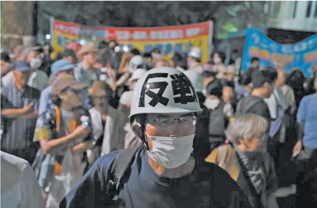
图为近日，民众在日本广岛和平纪念公园举行反战集会。