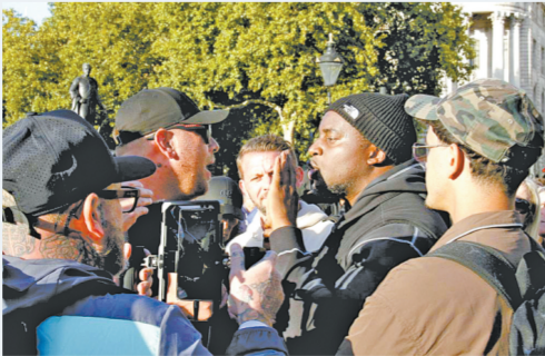
图为在英国首都伦敦，对移民持不同观点的人们在抗议活动现场争辩。