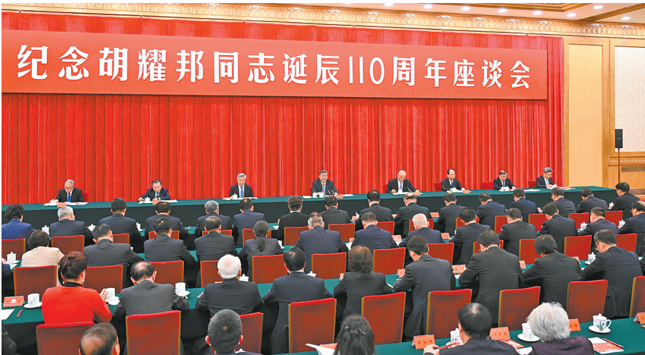
11月20日，中共中央在北京人民大会堂举行纪念胡耀邦同志诞辰110周年座谈会。习近平、蔡奇、李希等出席座谈会。

习近平强调，胡耀邦同志高度重视端正党风，为发扬党的优良传统和作风树立了光辉典范。全党同志特别是领导干部要像他那样保持一身正气，处处以身作则，锲而不舍落实中央八项规定精神，坚决抵制不正之风和腐败现象，始终保持共产党人清正廉洁的政治本色。（讲话全文另发）