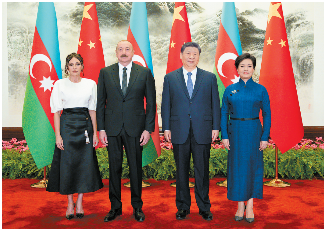
4月23日上午，国家主席习近平在北京人民大会堂同来华进行国事访问的阿塞拜疆总统阿利耶夫举行会谈。这是习近平和夫人彭丽媛同阿利耶夫和夫人阿利耶娃合影。

新华社北京4月23日电 记者董雪 冯毅然 4月23日上午，国家主席习近平在北京人民大会堂同来华进行国事访问的阿塞拜疆总统阿利耶夫举行会谈。两国元首宣布，建立中阿全面战略合作伙伴关系。