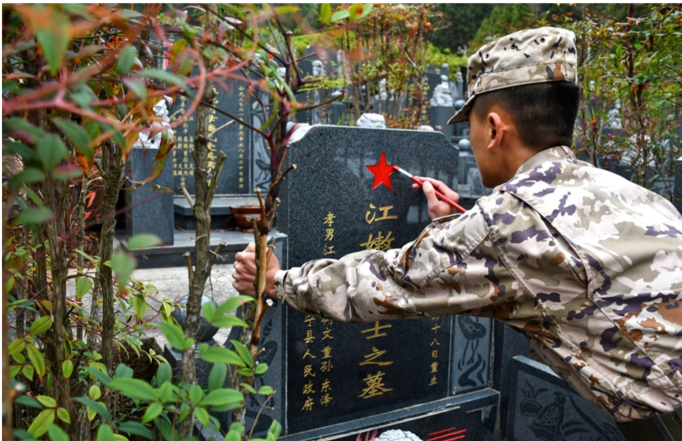
图为武警三明支队官兵为烈士墓碑描红。