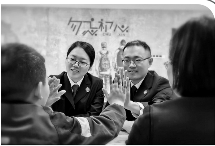
图为“莎姐”检察官在未检办案区帮教涉案未成年人。