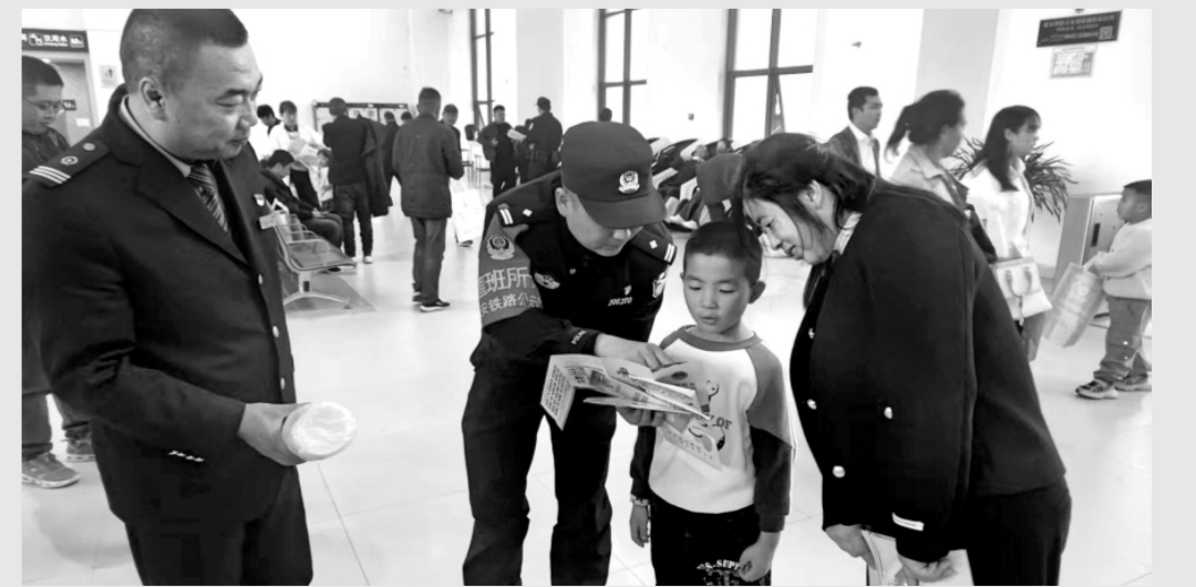
近日,西安铁路公安局延安公安处绥德站派出所联合陕西省榆林市绥德县应急管理局、中国铁路西安局集团有限公司绥德工电段等单位在绥德县火车站联合开展春节消防安全宣传活动,确保节日期间消防安全。图为民警和车站工作人员向旅客介绍铁路出行禁止携带物品与烟花爆竹安全使用注意事项。

在执法责任追究方面,对因故意或者重大过失,未履行,不当履行或者违法履行执法职责,造成危害后果或者不良影响,构成执法过错行为的,依法追究行政执法责任。结合消防行政执法工作实际,还明确了18项具体追责情形,涵盖了消防行政执法的全过程、全领域。同时,参照建立容错纠错机制、激励干部担当作为的相关规定,明确了12项不予追责的具体情形,实现失职问责与尽职免责相统一,督促和激励消防执法人员依法履职。