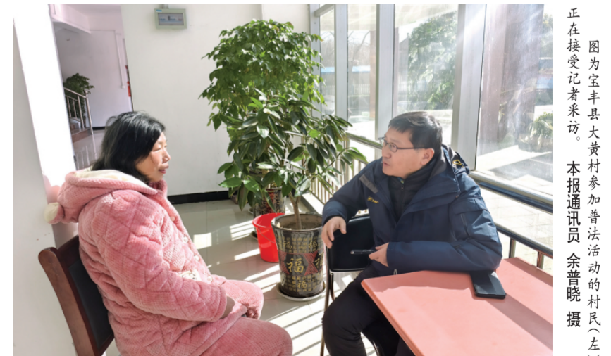
图为宝丰县大黄村参加普法活动的村民正在接受记者采访。