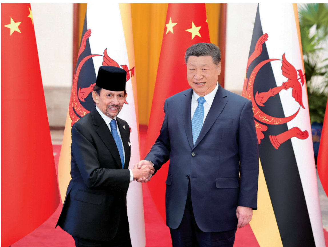
二月六日上午，国家主席习近平在北京人民大会堂同来华进行正式访问的文莱苏丹哈桑纳尔举行会谈。这是习近平同哈桑纳尔握手。

新华社北京2月6日电 记者邵艺博 董雪 2月6日上午，国家主席习近平在北京人民大会堂同来华进行正式访问的文莱苏丹哈桑纳尔举行会谈。