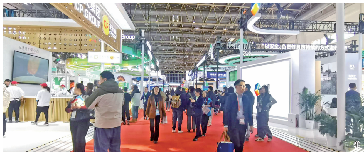
图① 第二届中国国际供应链促进博览会开幕当天,北京中国国际展览中心(顺义馆)内人流如织。