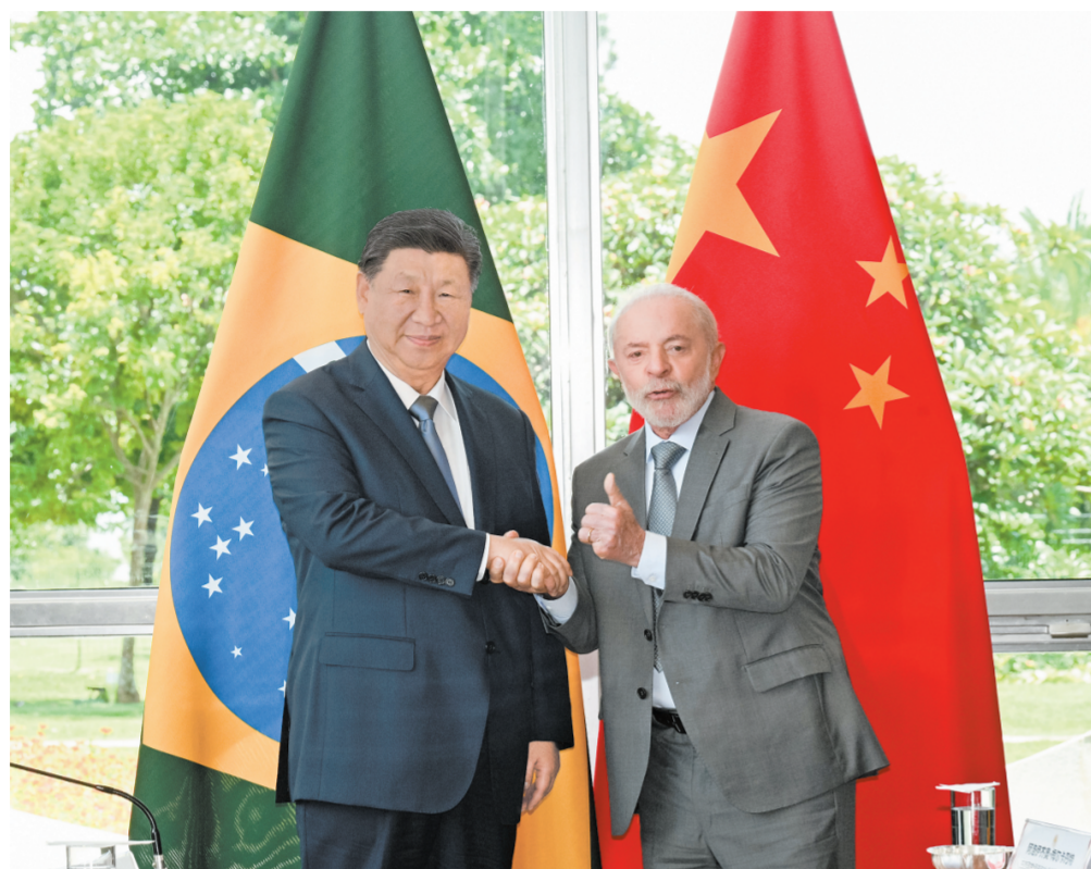
当地时间11月20日上午，国家主席习近平在巴西利亚总统府官邸黎明宫同巴西总统卢拉举行会谈。

新华社巴西利亚11月20日电 记者倪四义 陈威华 当地时间11月20日上午，国家主席习近平在巴西利亚总统府官邸黎明宫同巴西总统卢拉举行会谈。两国元首宣布，将中巴关系定位为携手构建更公正世界和更可持续星球的中巴命运共同体。