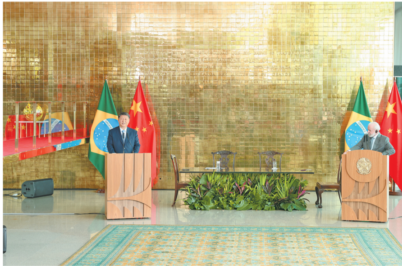
当地时间11月20日上午，国家主席习近平同巴西总统卢拉在巴西利亚总统府官邸黎明宫会谈后共同会见记者。