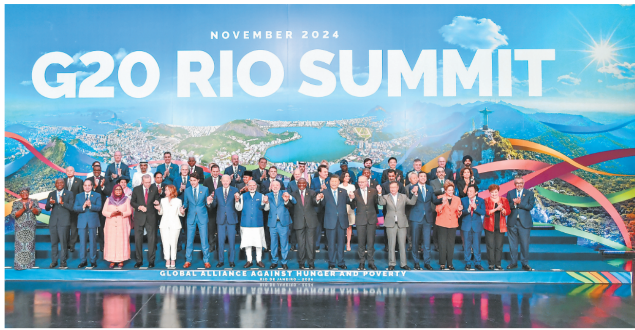
当地时间11月19日中午，国家主席习近平在里约热内卢出席二十国集团领导人第十九次峰会闭幕会议。这是闭幕会议后，习近平同其他与会领导人合影。

新华社里约热内卢11月19日电 当地时间11月19日中午，国家主席习近平在里约热内卢出席二十国集团领导人第十九次峰会闭幕会议。蔡奇、王毅陪同出席。