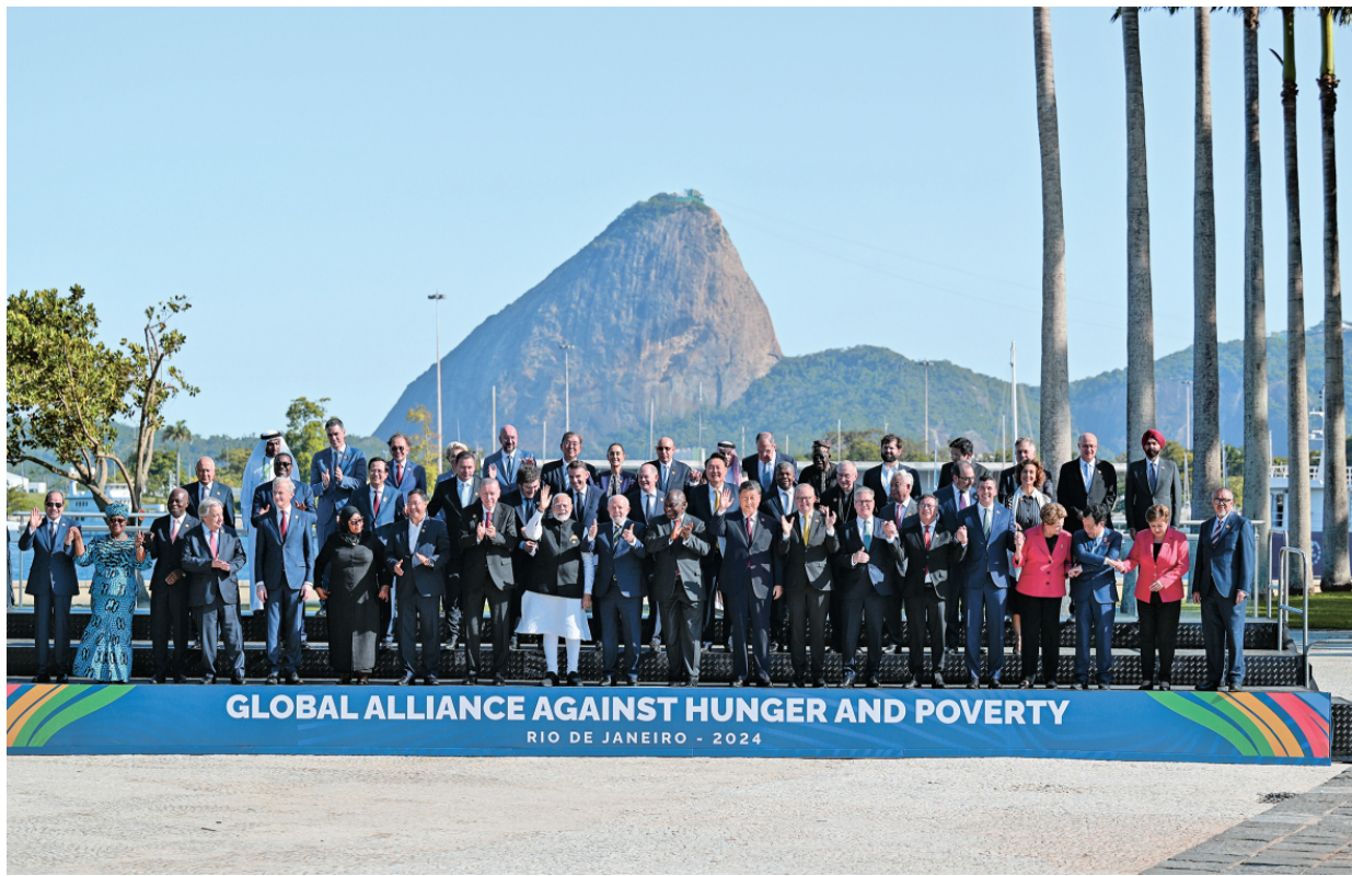
当地时间11月18日上午，国家主席习近平在巴西里约热内卢出席二十国集团领导人第十九次峰会。峰会把“构建公正的世界和可持续发展的星球”作为主题，并决定成立“抗击饥饿与贫困全球联盟”。这是习近平同与会领导人共同参加巴方发起的“抗击饥饿与贫困全球联盟”合影。