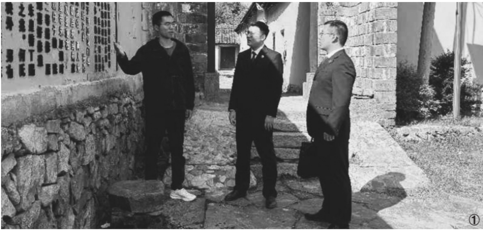
图① 商城县检察院检察官深入古村落进行回访。