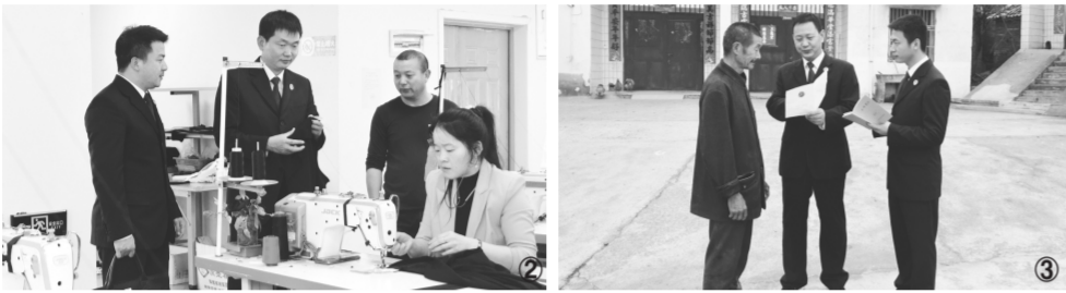
图② 商城县检察院检察官向企业负责人提示法律风险。