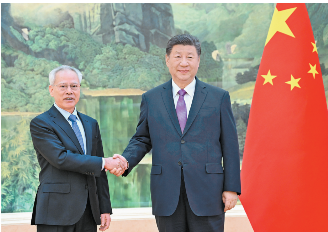
十一月一日下午，国家主席习近平在北京人民大会堂会见新任澳门特别行政区行政长官岑浩辉。