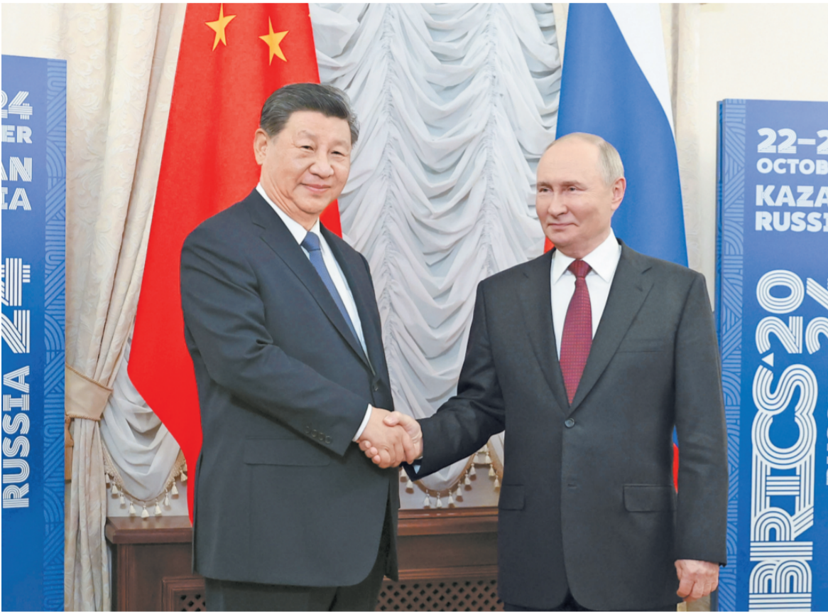
当地时间十月二十二日下午，国家主席习近平在喀山克里姆林宫同俄罗斯总统普京举行会晤。

新华社俄罗斯喀山10月22日电 记者郝薇、黄河 当地时间10月22日下午，国家主席习近平在喀山克里姆林宫同俄罗斯总统普京举行会晤。 习近平指出，今年是中俄建交75周年。75年来，中俄关系风雨兼程，探索出“不结盟、不对抗、不针对第三方”的相邻大国正确相处之道。双方秉持永久睦邻友好、全面战略协作、互利合作共赢精神，不断深化和拓展全面战略协作和各领域务实合作，为推动两国发展振兴和现代化建设注入强劲动力，为增进中俄人民福祉、维护国际公平正义作出重要贡献。当前，世界正处于百年未有之大变局，国际形势变乱交织，但中俄世代友好的深厚情谊不会变，济世为民的大国担当不会变。尽管面临复杂严峻的外部形势，两国贸易等各领域合作积极推进，大型合作项目稳定运营。双方要继续推动共建“一带一路”倡议和欧亚经济联盟深入对接，为促进各自经济高质量发展