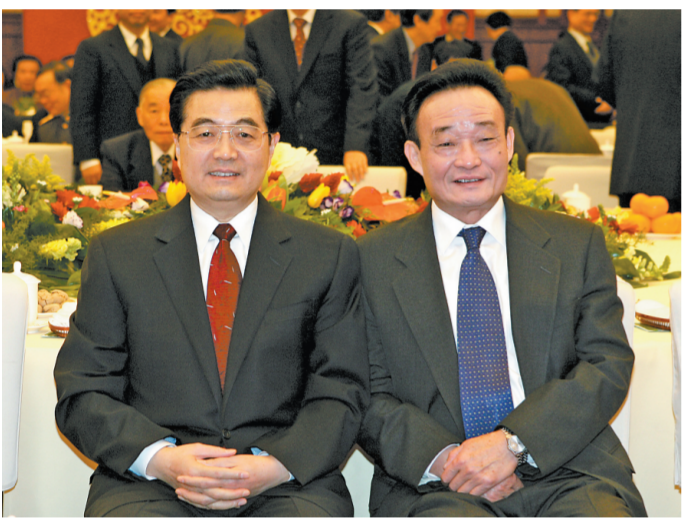
2005年1月1日，全国政协在北京举行新年茶话会。这是胡锦涛同志与吴邦国同志在一起。