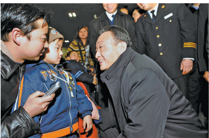
2008年2月3日，吴邦国同志在北京西站候车室与旅客交谈。