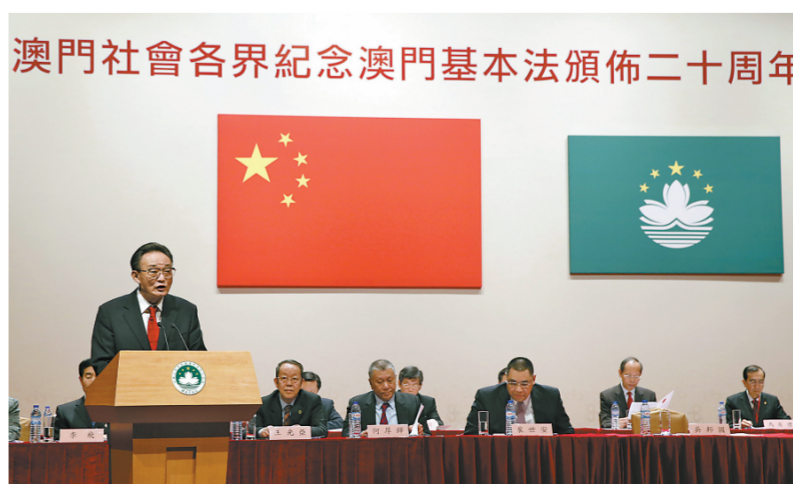
▲ 2013年2月21日，吴邦国同志在澳门文化中心出席澳门社会各界纪念澳门基本法颁布20周年启动大会并发表讲话。