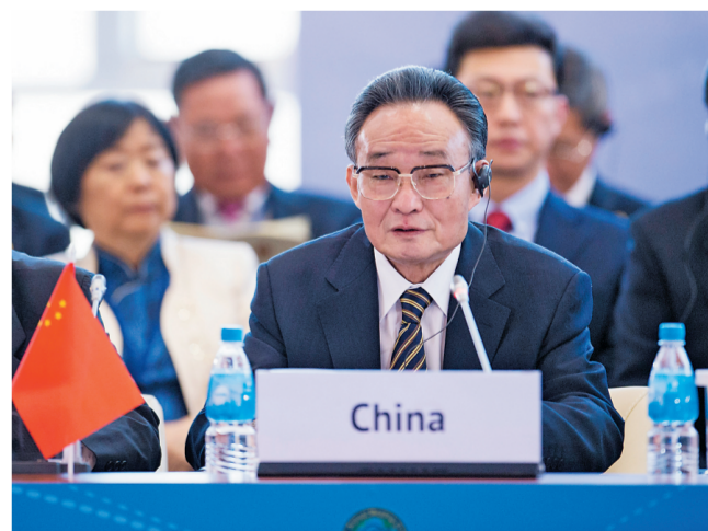
▲ 2013年1月28日，吴邦国同志在俄罗斯符拉迪沃斯托克出席亚太会议论坛第21届年会，并作题为《坚持和平发展 促进合作共赢》的主旨发言。