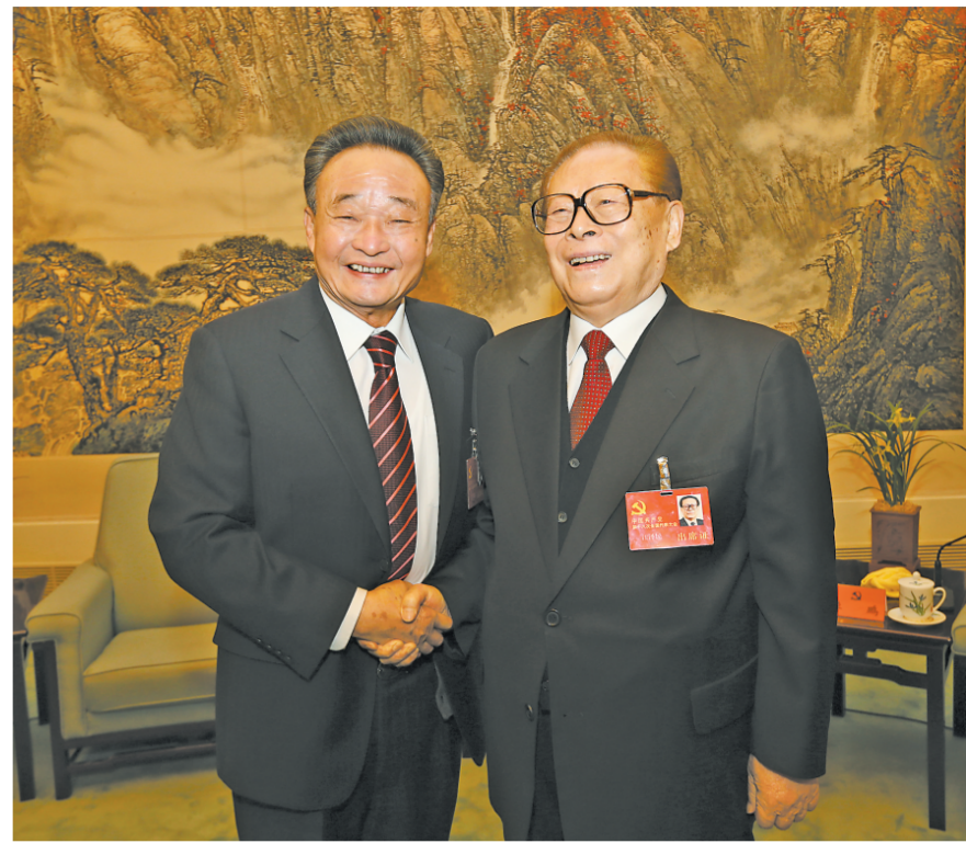
2012年11月14日，中国共产党第十八次全国代表大会在北京闭幕。这是闭幕会前，江泽民同志与吴邦国同志在一起。