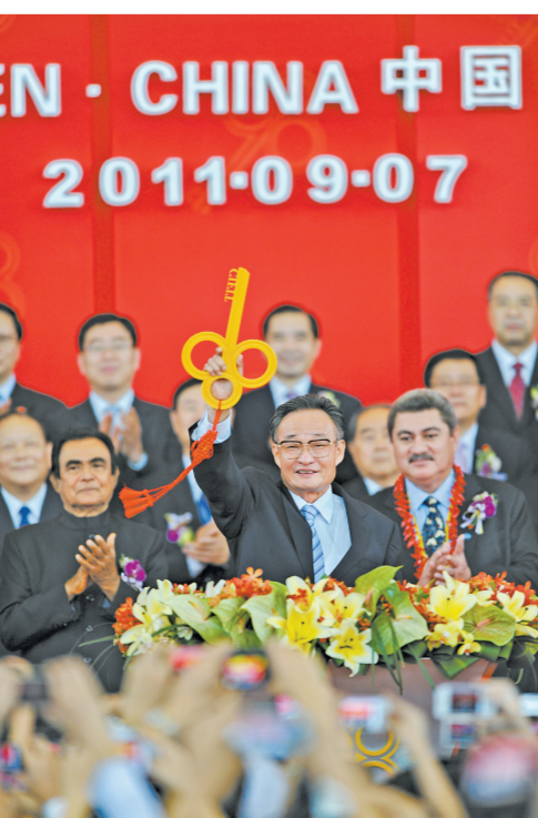
▲ 2011年9月7日，吴邦国同志在福建厦门出席第十五届中国国际投资贸易洽谈会开幕式。