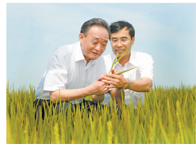
▲ 2012年7月19日，吴邦国同志在黑龙江农垦建三江管理局二道河农场万亩大地号察看水稻长势。