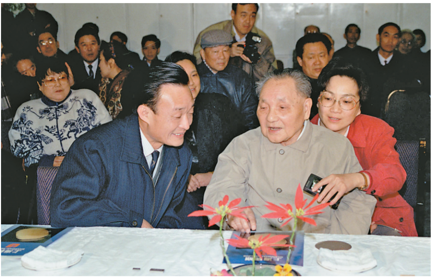
▲ 1992年2月10日，邓小平同志在上海贝岭微电子制造有限公司参观时与吴邦国同志交谈。