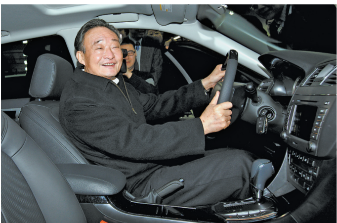
2010年1月30日，吴邦国同志在上海汽车集团股份有限公司技术中心察看新能源汽车。