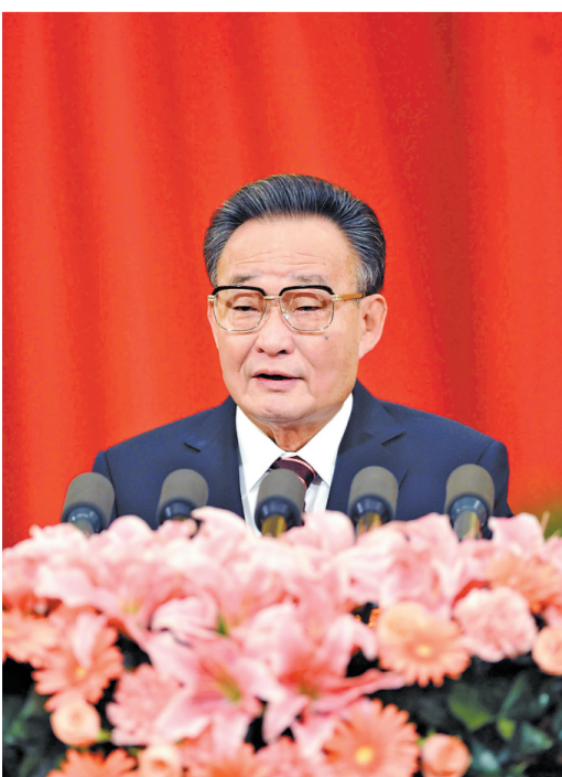
▲ 2011年3月10日，十一届全国人大四次会议在北京人民大会堂举行第二次全体会议。吴邦国同志作全国人大常委会工作报告。