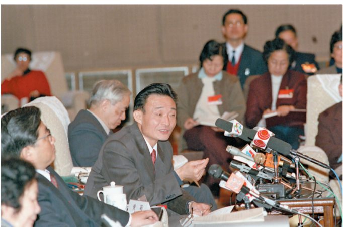
1994年3月，时任上海市委书记的吴邦国同志在全国两会上海代表团全团会议上。