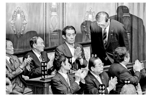
图为当地时间2024年10月1日，日本自民党新总裁石破茂在临时国会众议院和参议院进行的首相指名选举中，均获得超过半数选票，正式当选为日本首相。

施政方面，表示会深刻反省“黑金”问题，努力提高政治透明度；国民经济方面，承诺尽早制定高物价对策，提高最低工资水平；外交安保方面，强调以日美同盟为基础，并未提及此前曾提出的构建“亚太版北约”和修改日美地位协定；振兴地方经济方面，计划加倍投入地方转移支付预算，并成立领导机构，制定今后