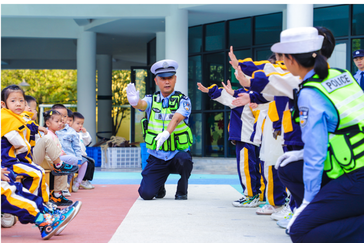
近日,江西省新余市公安局交警支队组织民警深入校园,以互动游戏方式开展“知危险会避险”安全体验课,提升学生的安全和文明出行意识。图为交警正在与学生做互动游戏。