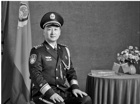
□ 本报记者 刘志月 文/图 □ 本报通讯员 宋建彬

办案有瘾。谈起“在一起时间比跟老婆还长”的同事廖振江，湖北省十堰市公安局治安支队食药环大队大队长项智这样评价。